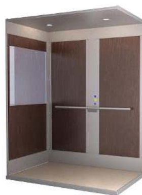
Élégance (miroir en option)